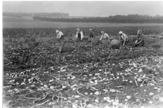
Arbejdere i kartoffelmarken

Den sidste ejer i denne fortælling er De Danske Spritfabrikker, som købte Frederikshøj i 1921. Med denne ejer, sker der et skifte i udnyttelsen af gården. Tidligere var den benyttet som enten et investeringsobjekt, eller som landbrugsvirksomhed. Nu kom der en ny dimension ind, nemlig som forsøgsgård for spritfabrikkerne. Hvad det dækker over, og den dermed forandrede fremtid og historie, vil jeg overlade til andre at beskrive.