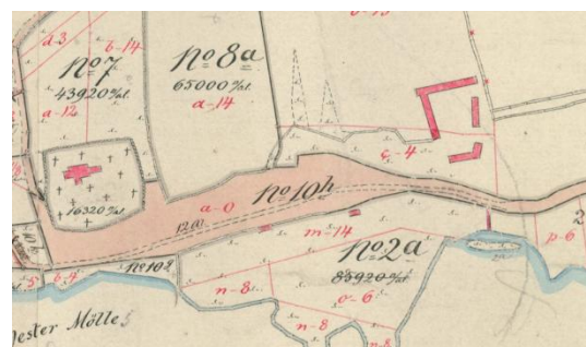
Kort der viser Kirken og Frederikshøj

Gårdens have og plantage skal renholdes og behandles med omhu, og han må ikke på nogen måde omhugge, rydde eller borttage buske eller træer, det være sig i haven eller andet sted paa ejendommen.