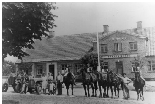
Frederikshøj ved en senere lejlighed.